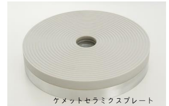
ケメットセラミクスプレート