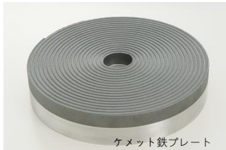
ケメット鉄プレート