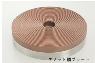
ケメット銅プレート