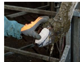
押して密着させる